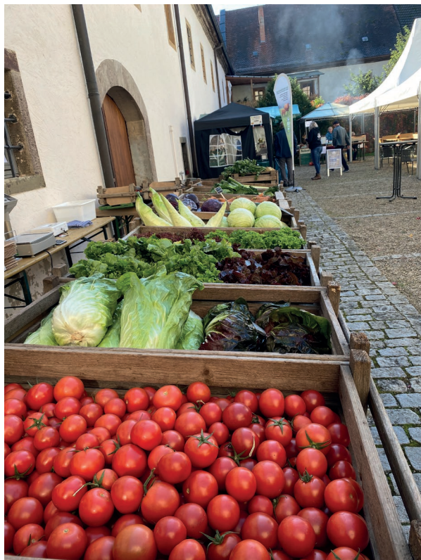
Foto: Gemüse aus Maria Bildhausen

Für Ihre Unterstützung danken Ihnen herzlich die NES-Allianz und die Ökomodellregion!