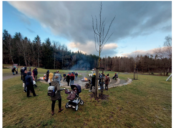
Infoveranstaltung Waldkindergarten am 19.12.2021

In einem Waldkindergarten wird das Naturverständnis und Umweltbewusstsein der Kinder sehr früh geweckt und die kognitiven Fähigkeiten, sozialen Kompetenzen sowie Kreativität in besonderer Weise entfaltet. Im Gegensatz zu Kindergärten mit Walddagen halten sich die Kinder im Waldkindergarten das ganze Jahr über im Freien auf. Eine Schutzhütte bietet bei schlechtem Wetter Aufenthaltsmöglichkeit. Der Alltag im Freien stärkt das Immunsystem und lässt die Kinder ihren natürlichen Bewegungs- und Entdeckerdrang ausleben. Nach dem Motto „Spielzeug zerbricht, Erlebnisse bleiben“ können die Kinder im Waldkindergarten nachhaltige und tiefe Lernerfahrungen durch eigenes Handeln sammeln.