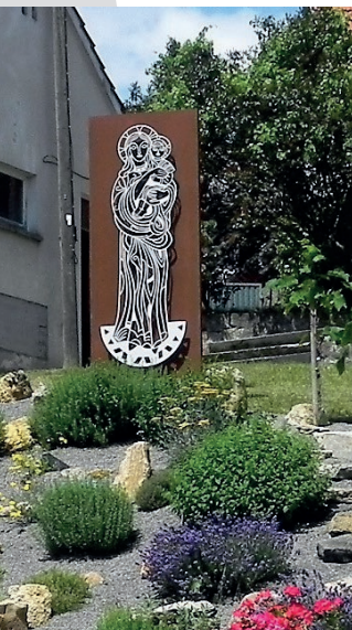
Mutter Gottes im Kräutergarten