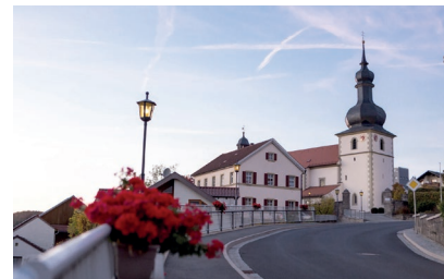
Weg zur Kath. Kirche

Goethestr. 13 97616 Bad Neustadt a. d. Saale Tel. 09771 6 36 96-10 Fax 09771 6 36 96-70