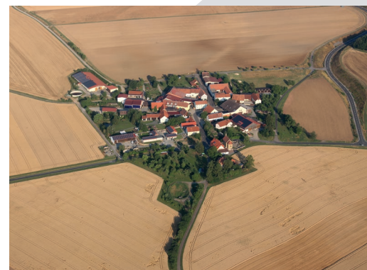
Bilder vom Weiler Rheinfeldshof

In Strahlungen treffen sich wöchentl. am Mittwoch von 9:00 - 12:00 Uhr (je nach Bedarf) mehrere aktive Rentner um unsere Heimatgemeinde attraktiver zu gestalten, Bänke zu setzen und zu pflegen, im Garten des Kindergartens zu helfen oder beim Aufbau von Festen tatkräftig zu unterstützen. Bei Interesse melden Sie sich bitte beim 1. Bürgermeister.