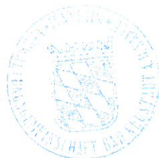
Karola Back 1. Bürgermeisterin